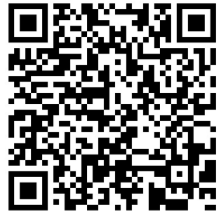
史上最全Vim快捷键键位图