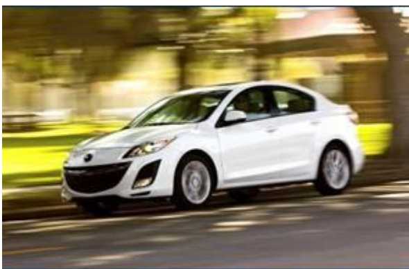
图 25：全新马自达 3 三厢-1

全新马自达 3 是即将国产的一款新车，对比进口两厢版本，国产新马自达 3 在前脸上不会做任何改动。不过，在后保险杠上，国产马自达 3 三厢版本的尾灯与海外三厢版本有不同，而且有几种不同的颜色搭配。因后厢较短马自达 3 三厢车身尺寸会比较短，但整车乘员空间却会比较充裕。