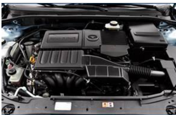
图 26：全新马自达 3 三厢-2