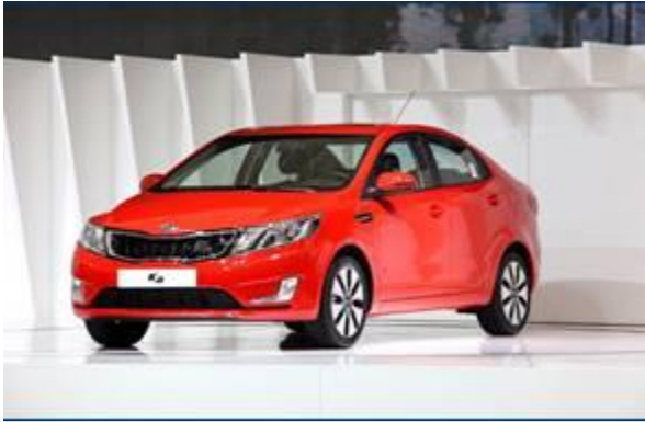
图 16：东风悦达起亚 K2-1

起亚 K2 由设计师彼得·希瑞尔专为中国消费者精心打造的轿车，将越级与动感的概念全方位体现出来。其外观线面融合、刚柔交错，营造动感、新锐的视觉感受。