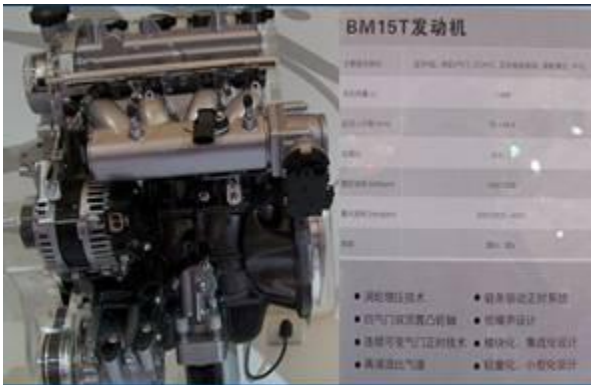
图 23：华晨中华 530-2