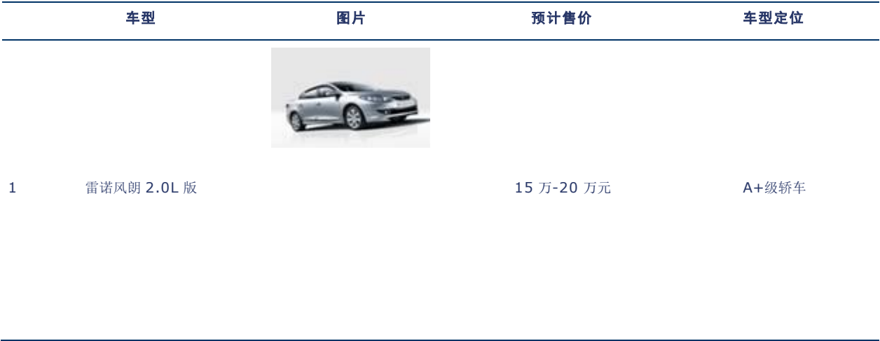
表 1：预计 6 月上市的主要车型汇总