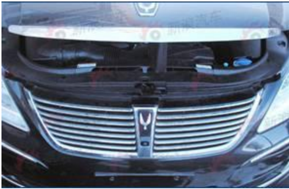
图 14：现代加长版改款雅科仕-2