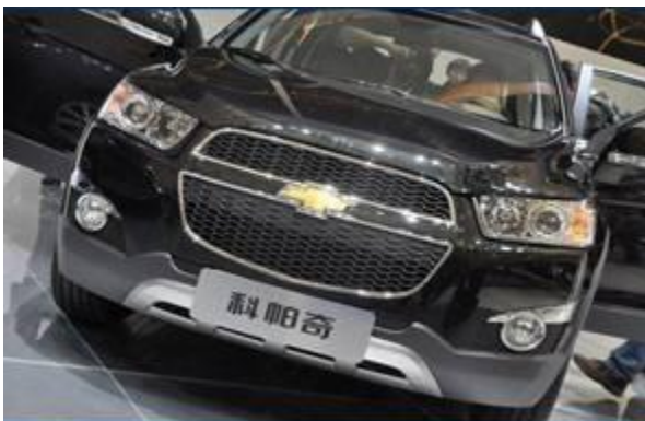
图 10：雪佛兰新款科帕奇-1