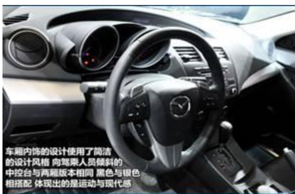
图 27：全新马自达 3 三厢-3

动力方面： 国产新马自达 3 会继续采用现款马自达 3 的发动机，继续搭载 1.6L 和 2.0L 发动机。而在变速箱方面，与其匹配的是 4 档自动变速箱。