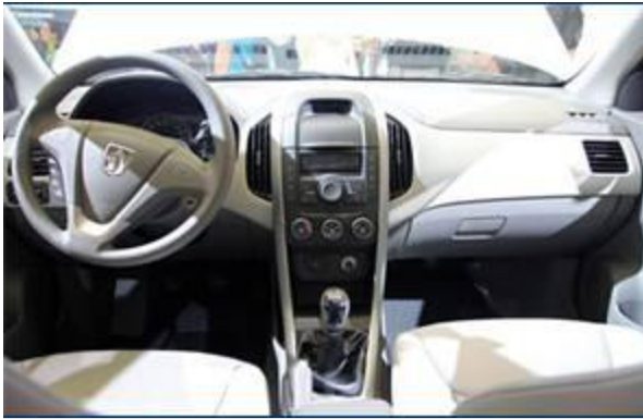
图 21：上汽通用五菱宝骏 630-3

动力方面：宝骏 630 先期将推出的是 1.5L 发动机，这台 P-TEC 发动机在宝骏 630 上可发挥出 81kW（110 马力）的最大功率和 146N·m 的峰值扭矩，与之匹配的是 5 速手动变速箱和 6 速手自一体变速箱。而 1.8L 车型在未来推出。