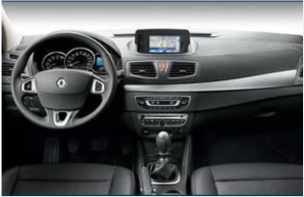
图 3：雷诺风朗 2.0L 版-3

动力方面： 雷诺风朗在欧洲市场提供了 7 款发动机匹配，包括了 2 款汽油机和 5 款柴油发动机。6 月就将导入中国市场的风朗先期将提供 2.0 升发动机供选择。最大功率为 140 马力，2.0 升车型还将匹配 CVT 变速箱，从而进一步提升换挡平顺性和燃油经济性。