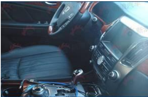
图 15：现代加长版改款雅科仕-3

动力方面：现代加长版的雅科仕配备的是一台排量达到 5.0L 的 V8 发动机，最大功率高达 400 马力以上，超过了雷克萨斯 LS460 和奔驰 S500，与宝马 750Li 接近。当然，对于此类豪华车来说，多强的极限动力并不是主要的，关键还是看舒适和平顺。加长版雅科仕的搭载的变速器为 6 速手自一体变速器。