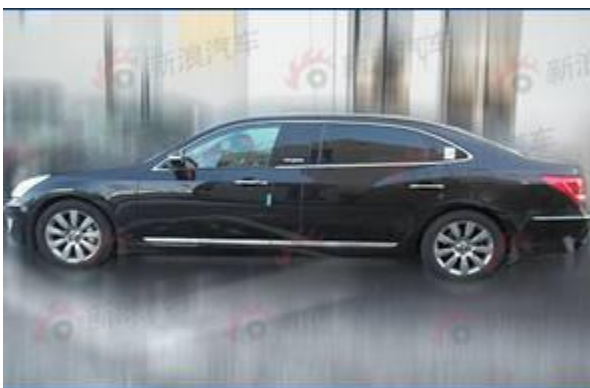
图 13：现代加长版改款雅科仕-1

现代加长版雅科仕在尺寸上做得比较夸张，比普通版总共加长了 345mm。，雅科仕的加长是采用 B 柱部位加长的方式，使车主称作时能够获得后排豪华乘坐感。以豪华级的定位与豪华品牌的行政级加长版雅科仕已瞄准了中国豪华车市场。