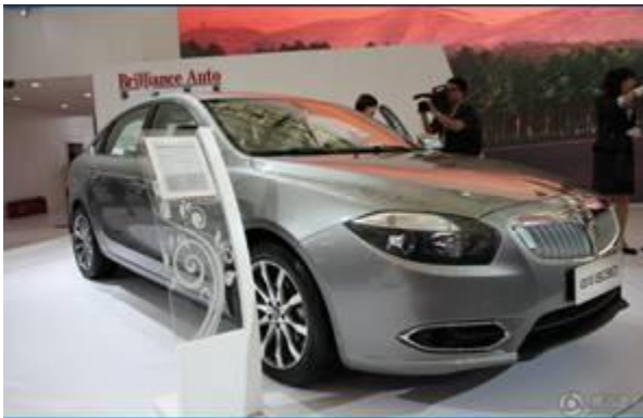
图 22：华晨中华 530-1