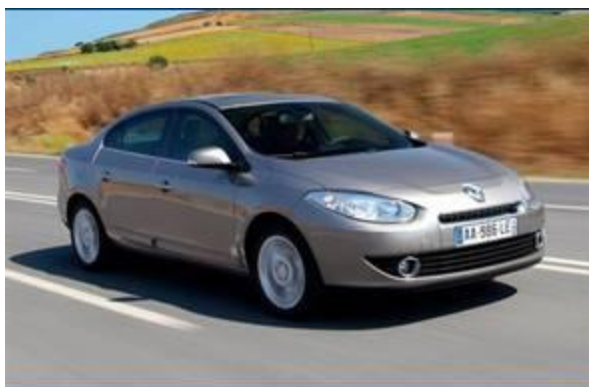
图 2：雷诺风朗 2.0L 版-2