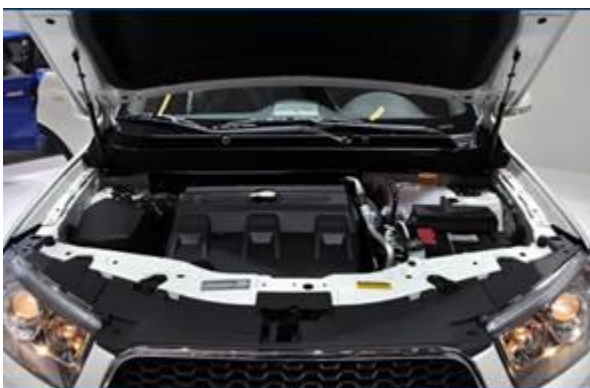
图 11：雪佛兰新款科帕奇-2