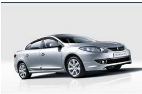
图 1：雷诺风朗 2.0L 版-1

Fluence 风朗是基于三厢梅甘娜开发的一款“大块头”A 级车型，虽然尺寸不小，但 Fluence 风朗没有采用大嘴与浮雕等夸张造型细节，外观更加主流大众。宝蓝色大灯透镜与灯眉与新一代双色尾灯的设计与纬度一样，比较出彩。前中网与引擎盖肌力线的 V 字形配，更显运动。