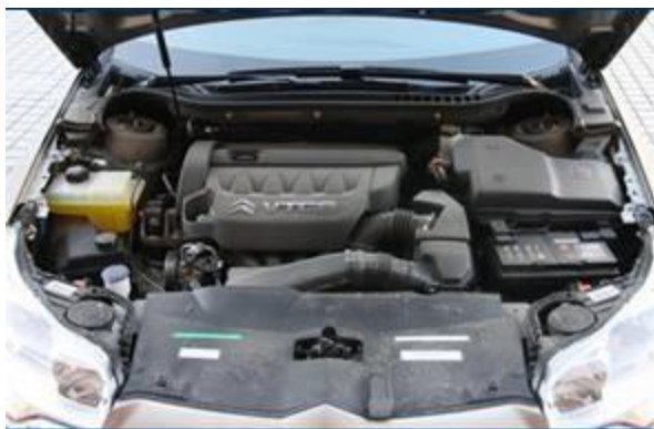
图 8：东风标致 508-2