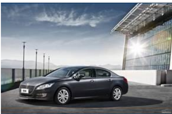
图 7：东风标致 508-1

东风标致 508 是在 PSA 全球样板工厂三号平台生产，受到神龙工厂苛刻的监测。作为东风标致首款 B 级车，508 将代表东风标致在更高级别平台上开疆拓土。