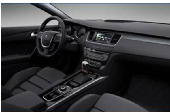
图 9：东风标致 508-3

动力方面： 国产标致 508 将采用与现款国产雪铁龙 C5 相同的动力。分别搭载 2.0L RFN 10LH3X 发动机和 2.3L3FY 10XP01 发动机，两种排量发动机都配备一款六速自动变速箱，其中 2.0L 型号还提供 5 挡手动变速箱。