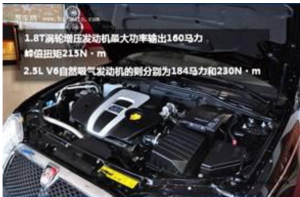
图 5：全新荣威 750-2