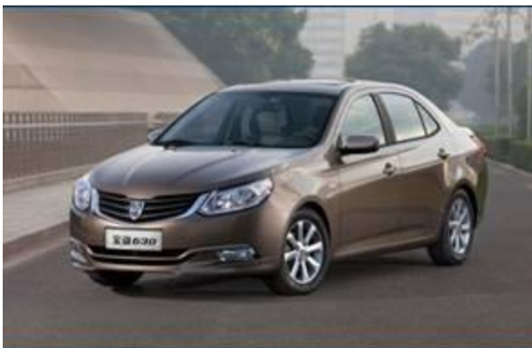
图 19：上汽通用五菱宝骏 630-1

宝骏 630 是上汽通用五菱推出的首款自主品牌乘用车型，该车是在通用汽车的成熟技术基础上，由泛亚技术中心进行重新开发设计，结合中国消费者动态需求全新开发的，意在主攻二、三线汽车市场。