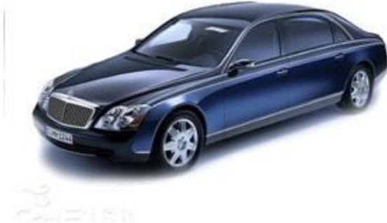
图 5：复出后的第一款车迈巴赫 57（2002 年）

2002 年 7 月，奔驰公司又恢复了迈巴赫品牌。迈巴赫从一开始就被定位于等级最高的超级豪华轿车，被公众视为财富、地位与地位的象征。迈巴赫品牌代表着无与伦比的优秀品牌，匠心独运的制作工艺，不断突破的科技水平，以及卓尔不群的尊贵气质。深厚的文化底蕴，精湛的技术，至高的品质，独特的风格，使其成为全球瞩目的焦点。2006 年，迈巴赫全球的销量超过 400 辆。