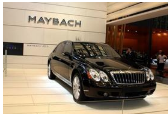
图 6：迈巴赫 62