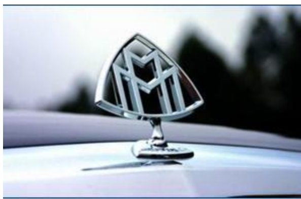
图 7：Maybach 的立标

具有传奇色彩的品牌迈巴赫标志由两个交叉的 M 组成，围绕在一个球面三角形里面组成。新的迈巴赫轿车将仍采用这个经典的标志，不同的仅仅是，以前两个 M 的是 Maybach Motorenbau（迈巴赫发动机制造）的缩写，而现在的两个 M 则是 Maybach Manufaktur（迈巴赫制造）的缩写。