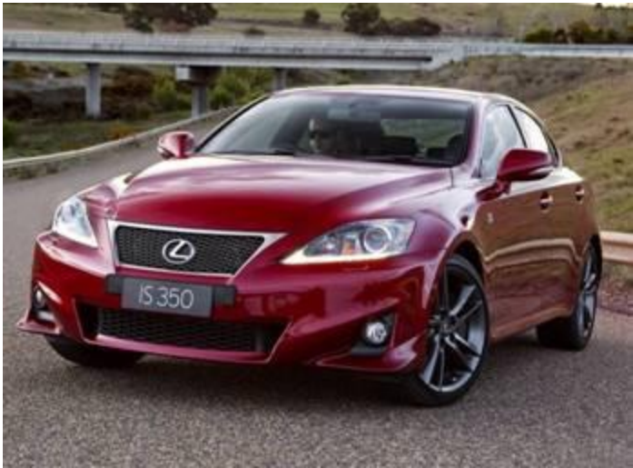
图 4：雷克萨斯 IS 外观与内饰

又到一年奖金时，年终奖该怎么消费呢？我们建议：买车！为此，我们上两期特为您奉上 20-30 万元价位的主流车型，包括轿车和 SUV 车型的汇总和介绍。考虑到各位朋友购车消费理念的差异，以及充分考虑到大佬们的需求，我们本期再次奉上 30-50 万元的车型汇总介绍，希望能够为您购车提供有用的参考。