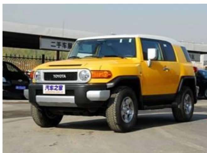
图 10：FJ 酷路泽外观与内饰