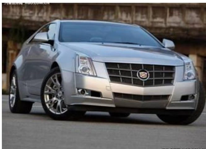
图 6：凯迪拉克 CTS 外观与内饰