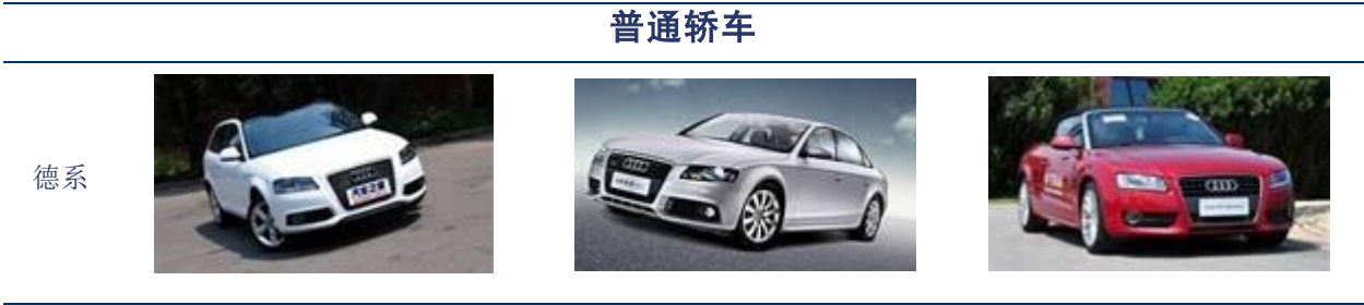
表 1：30-50 万主要车型汇总

根据 30-50 万元区间的购车偏好，按照车型的定位和用途无外乎轿车、跑车和 SUV 等三大类。30-50 万元可选车型较多，大多数豪华品牌的中低端车型、以及中端品牌的高端车型、甚至少数豪华品牌的小型跑车都落在这一区间；30-50 万元同样可以买到性能较好的越野性 SUV 和更高性能的城市 SUV；喜欢 MPV 的朋友同样有多种选择。丰富的选择有时候也是一种烦恼，为此，我们特地汇总列举了这一区间的主要车型，并附上部分主流车型的详细介绍，希望能为考虑买车或者换车的您提供有用的参考