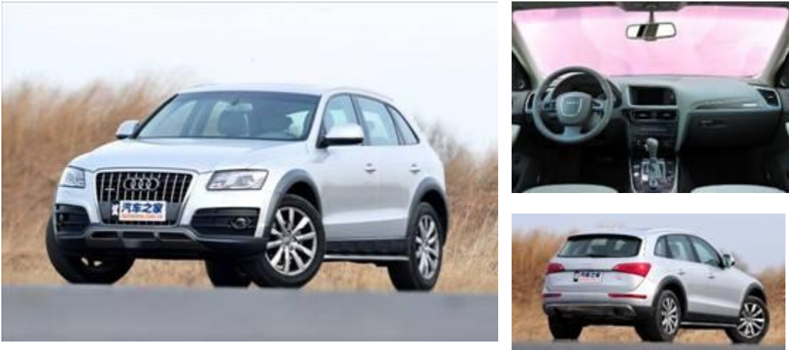
图 8：奥迪 Q5 外观与内饰