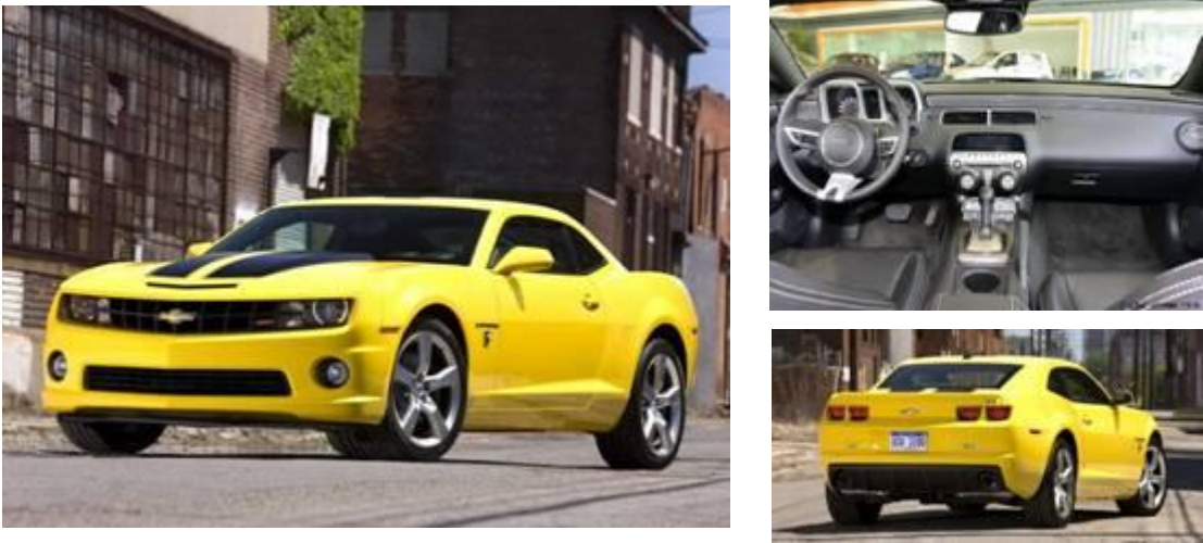
图 7：雪佛兰科迈罗外观与内饰