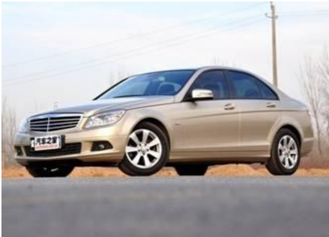
图 3：奔驰 C 级外观与内饰