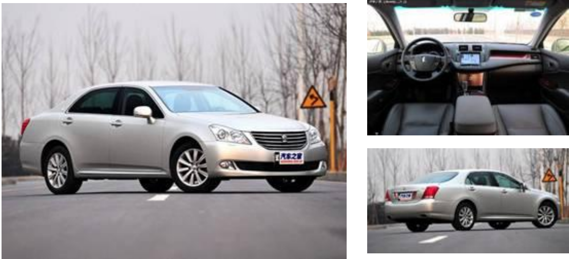
图 5：皇冠外观与内饰